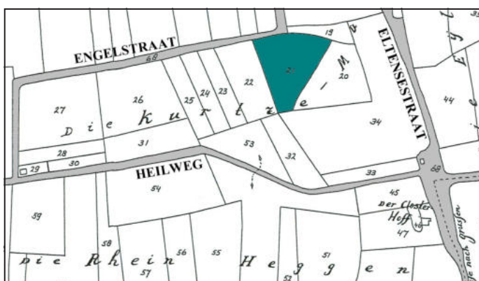
Folio 47 uit de Atlas van het Ambt Liemers (1735).

Wie zijn in 1735 de "buren" van perceel 21? Heel curieus, perceel 20, driehoekig van vorm,