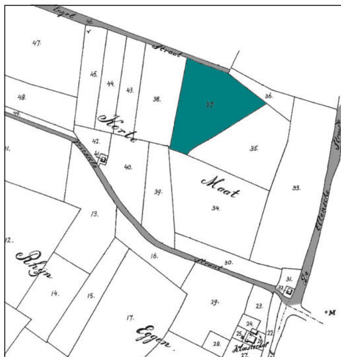
Kadastrale kaart (1832).

De Tiendcommissie roept aangever en bezwaarden op voor een bespreking van de aangifte. De vergaderingen vinden plaats op 26 mei en op 17 novem-