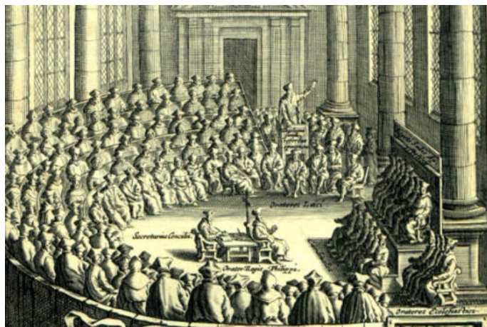
Concilie van Trente.

Bij de invoering van de burgerlijke stand in het begin van de 19de eeuw moesten de kerken hun registers bij de overheid inleveren. Deze registers dienden als basis voor de nieuwe burgerlijke stand registers. Dit betekende echter niet het einde van de kerkelijke administratie. Ook na de invoering van de Burgerlijke Stand bleven de kerken hun dopen en