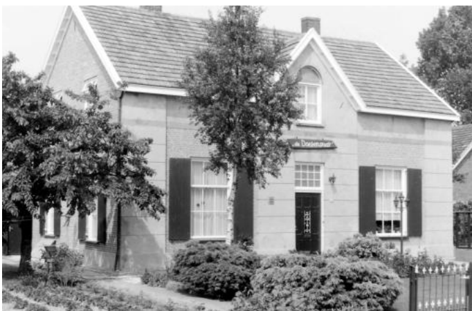
Boerderij "Doekenstadt", Loostraat 60 in 1989