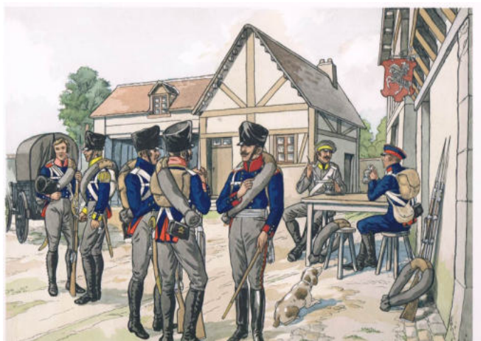
Leden van het 18e regiment van linie (drie op de voorgrond en twee rechts).

Binnen de coalitie werd besloten om langs de grenzen van Frankrijk grote legers te verzamelen om hiermee uiteindelijk eind Juni Frankrijk mee binnen te trekken. Twee ervan waren in de Zuid-