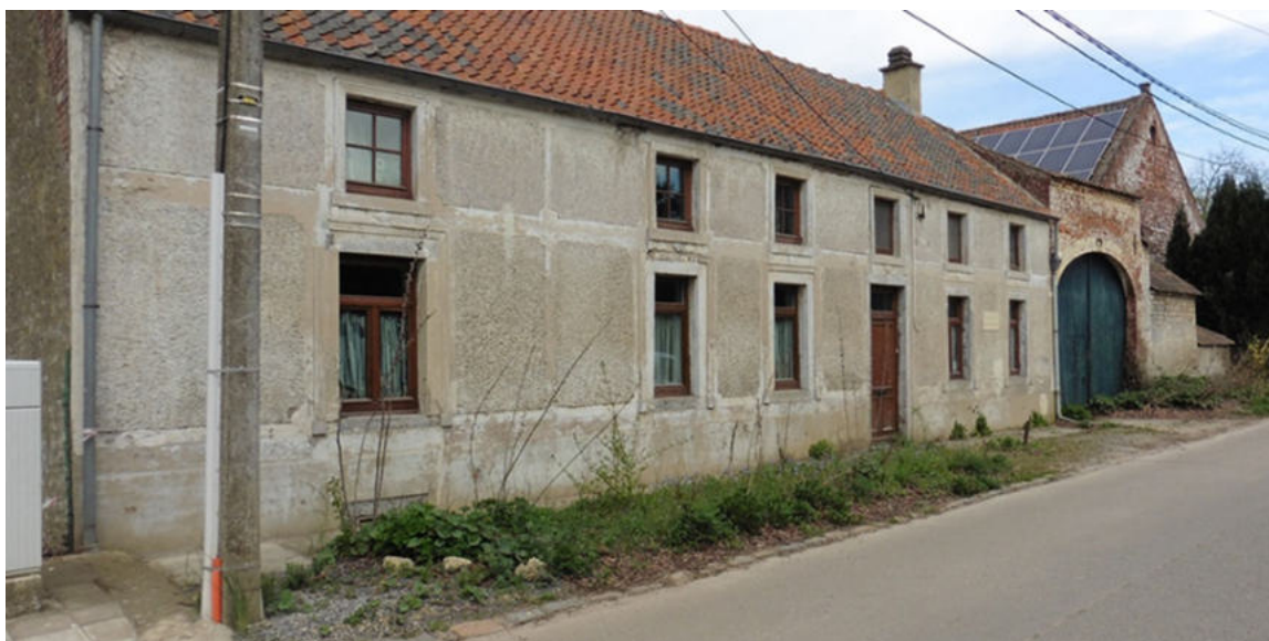
Het huis "à Tout Vend" heden ten dage.

Ondertussen had Wellington, na de terugtocht van Blücher naar het noorden, zich ook teruggetrokken uit Quatre Bras om niet alleen overgeleverd te zijn