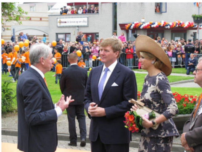
Koning Willem Alexander en koningin Maxima in gesprek met van Groningen tijdens hun bezoek aan Duiven op 30 mei 2013.

Natuur en cultuur veranderen mee in de tijd. De groeikern, de grootschalige bedrijvigheid brengen net zoals het water eeuwenlang in dit gebied heeft gedaan, veranderingen.