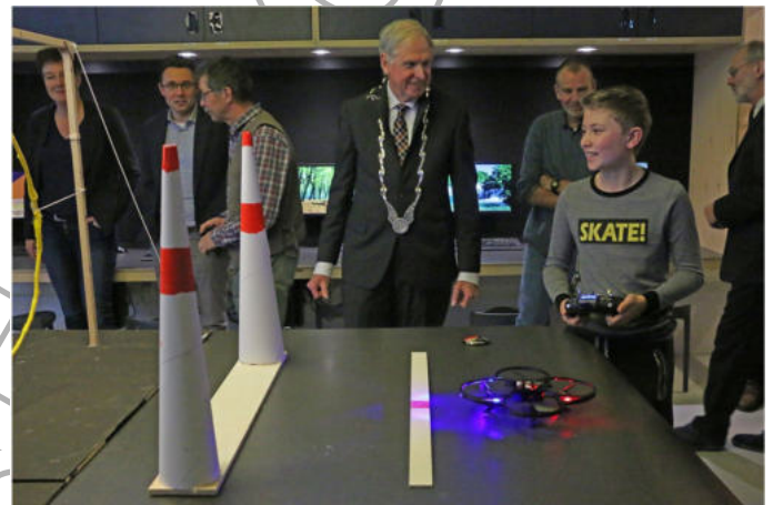
Opening Technasium januari 2018 Candea college Duiven.

Onderwijs is prachtig het geeft veel voldoening iets te mogen betekenen in het leven van jonge mensen. Het is geweldig te worden uitgenodigd aanwezig te zijn bij de presentatie van de dissertatie van oud-leerlingen bij een promotie als je de oud leerling al ruim 10 jaar niet meer hebt gezien. Om zomaar in de bouwmarkt te worden aangesproken en dan te horen dat het goed is gegaan met de oud leerling die je daar nu als vader met zijn kinderen tegenkomt.