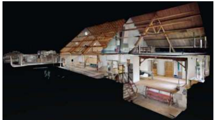
3D-scan (voorbeeld Helhoek 13)

zijn/worden teruggegeven aan (voormalige) bewoners.