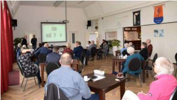
Bijeenkomst 6 november 2021, Dorpshuis Groessen, verhalen ophalen.

De gemeenten Lingewaard, Duiven en RWS zijn gestart met het project 'Verhalende ViA15'. De HKDGL heeft te kennen gegeven om hierin te willen participeren.