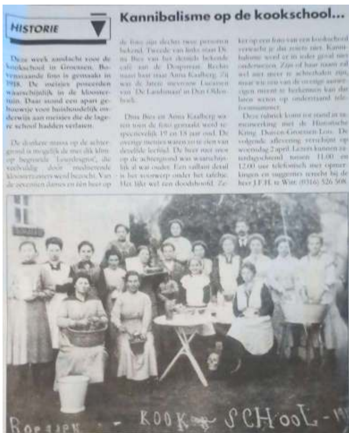
Kookschool 1918 Krantenartikel geschreven door J.F.H. te Witt

In 1907 werd een drie-klassige meisjesschool geopend met totaal 87 leerlingen.