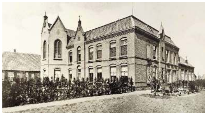
Sint-Antoniusgesticht - Groessen