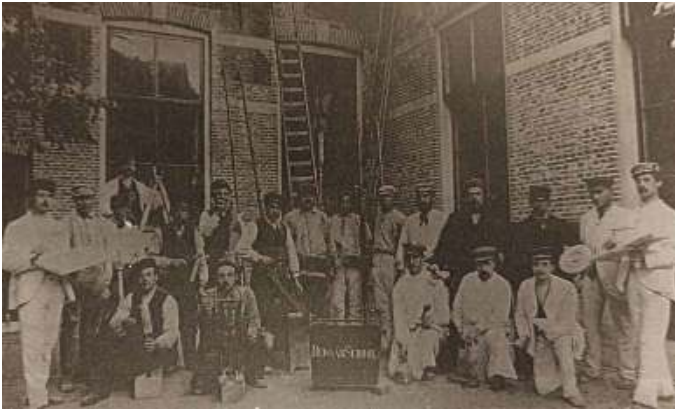
Sint-Antoniusgesticht in aanbouw