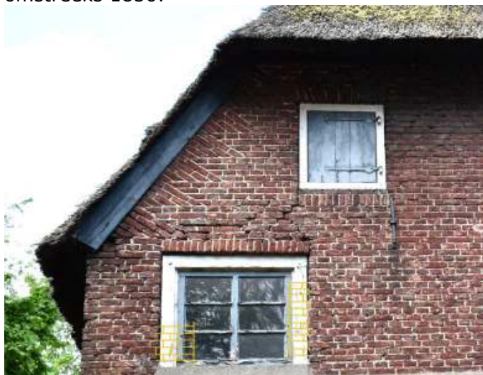
Detail rechter zijgevel: later in het werk ingehakte kozijnen van de luiken en vensters.

In het archief bleef een foto bewaard van de voorgevel en de linker zijgevel van de boerderij van voor 1937. De linker zijgevel van het bedrijfs gedeelte was destijds een stuk lager dan in de huidige situatie en bevatte drie houten mestluiken. Op de foto is verder te zien dat de vensterindeling van het woongedeelte reeds is gewijzigd, met op de begane grond zesruits Empire schuifvensters. Deze modernisering heeft plaatsgevonden in de 19e eeuw, waarschijnlijk omstreeks 1850.