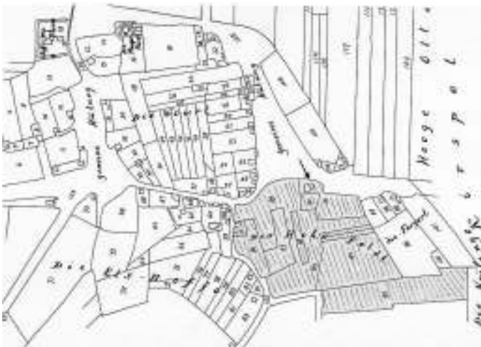
Op deze kaart bij de pijl 't Hoge Veld met de gearceerde percelen die erbij hoorden.