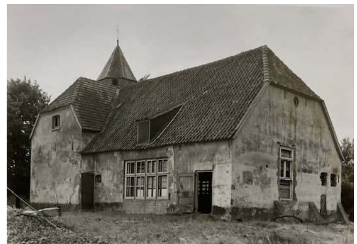
Die Magerhorst tot ruïne verworven