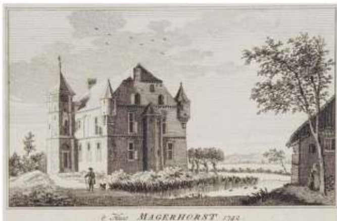
Pentekening van Jan de Beijer

De oude havezathe was eeuwenlang, sinds de 9 e eeuw een leen van de abdij Elten. Het goed werd al omstreeks 1400 vermeld en vóór de 16 e eeuw zou het geslacht Mom hier hebben gewoond. Een pentekening van Jan de Beijer toont het huis omstreeks 1742 als een versterkt huis met een gracht eromheen.