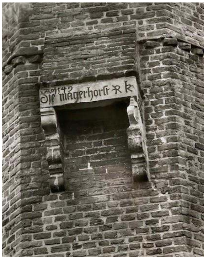
Bouwelement de zogenaamde mezekouw (mâchicoulis)

In 1546, werd volgens een leenakte van het vrije stift Elten, Claes van Egeren Loefzoon als bezitter van deze havezathe genoemd.