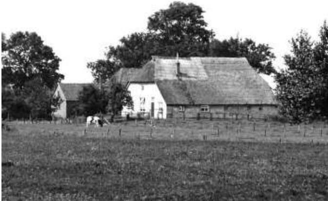
Horsterhof ca. 1970-1975.

De Horsterhof is een boerderij en werd omstreeks het midden van de 19 e eeuw gebouwd. Hij is van het type Hallehuis en bezit een rechthoekige plattegrond, één bouwlaag en een zadeldak met wolfseinden boven de voor- en achtergevel. Opvallend was dat de kenmerkende waterput die bij dergelijke boerderijen hoort, niet aanwezig was.