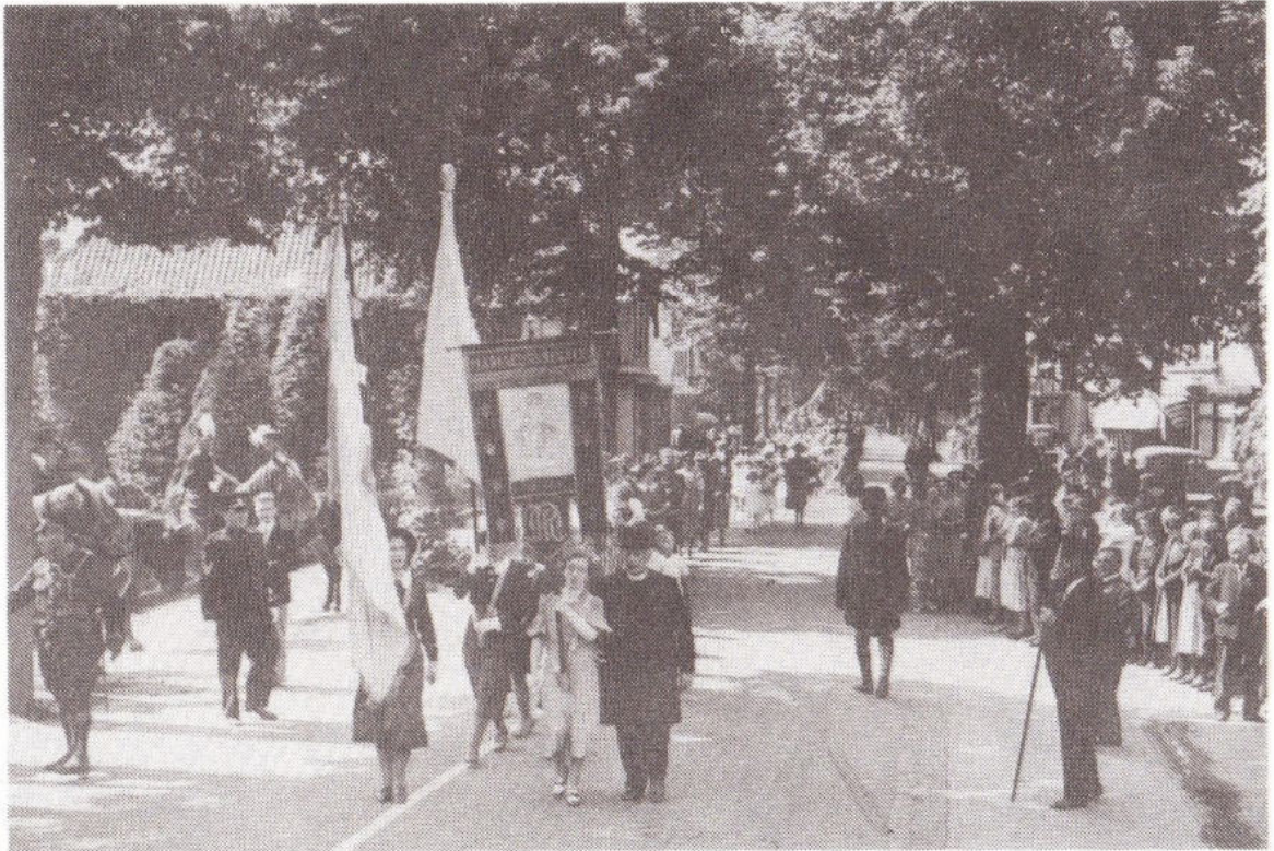
Intocht op 1 juni 1939 van de nieuwe burgemeester Sloet, in Duiven