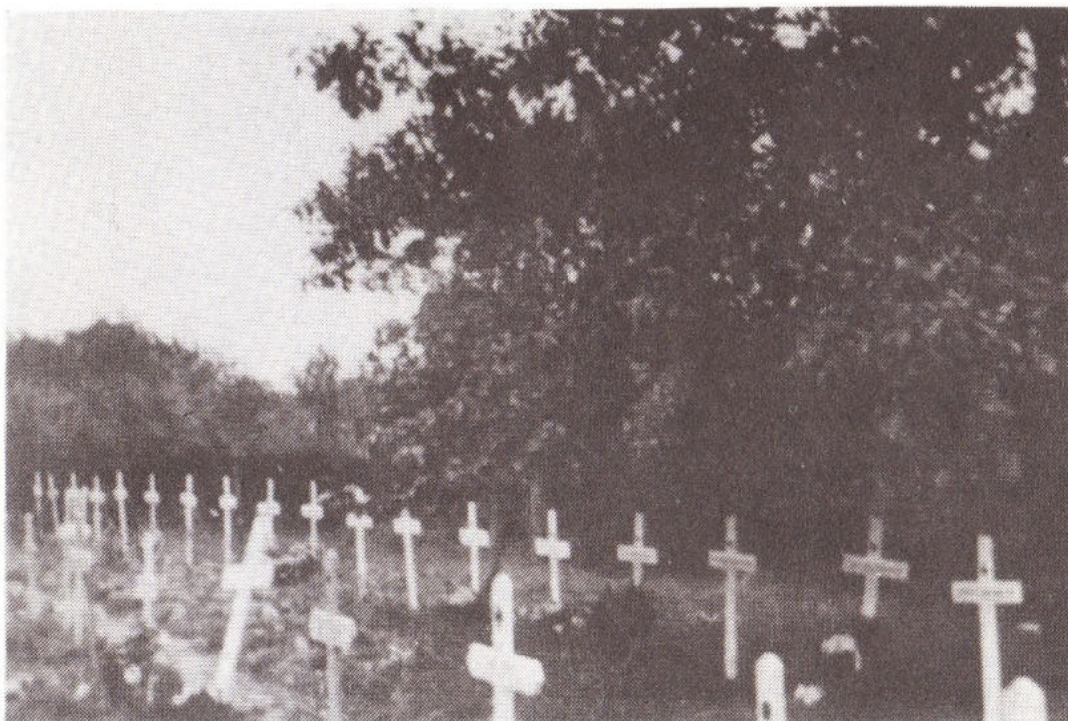
oktober 1944: Duits oorlogskerkhof bij café "Halfwegen".