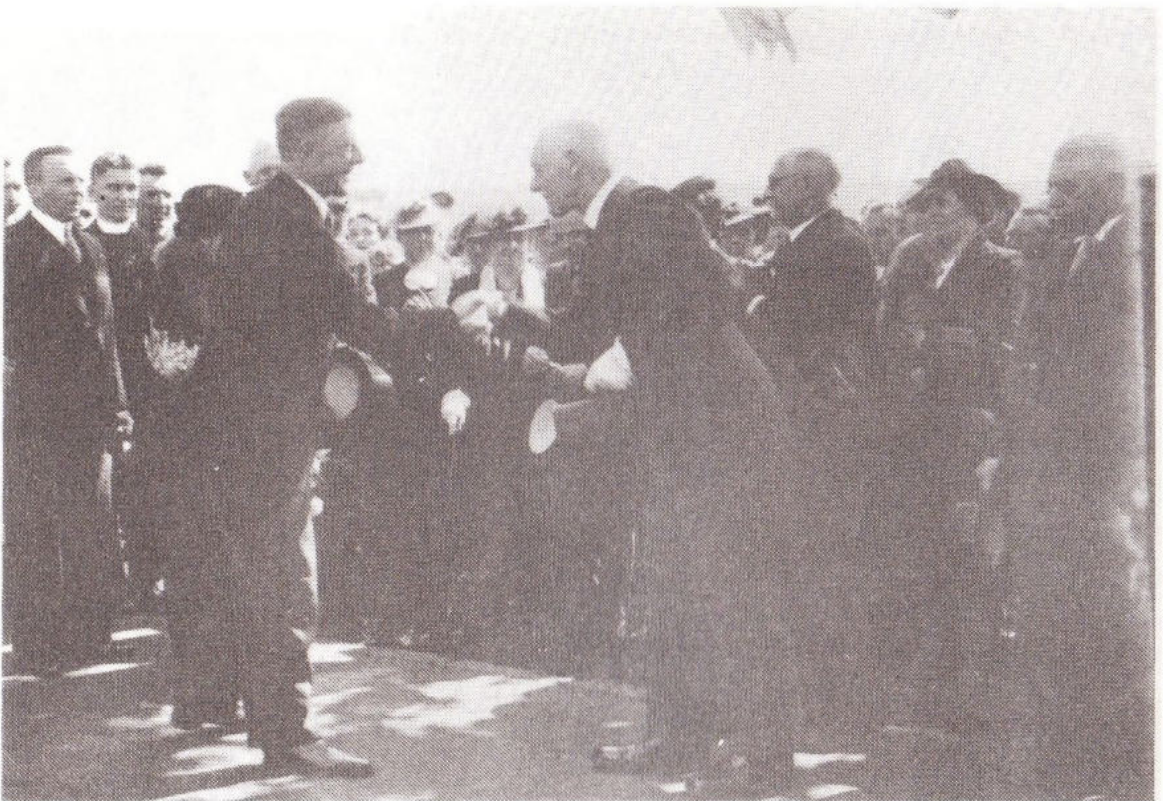
Begroeting van de nieuwe burgemeester door de wet- houders