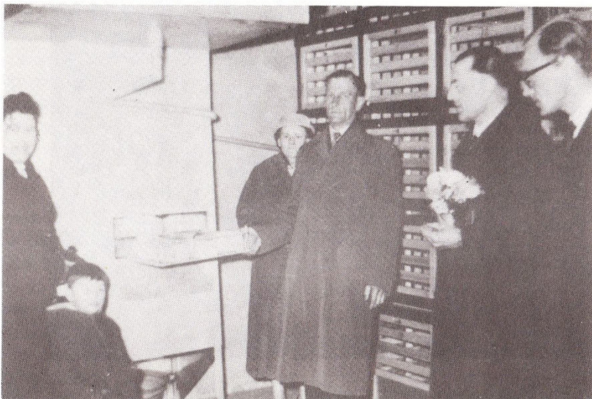
29 maart 1958: opening diepvriescentrale te Groessen