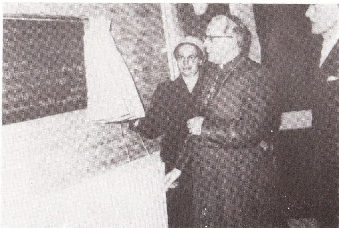
5 februari 1960: opening Thuvine door Kardinaal Alfrink.