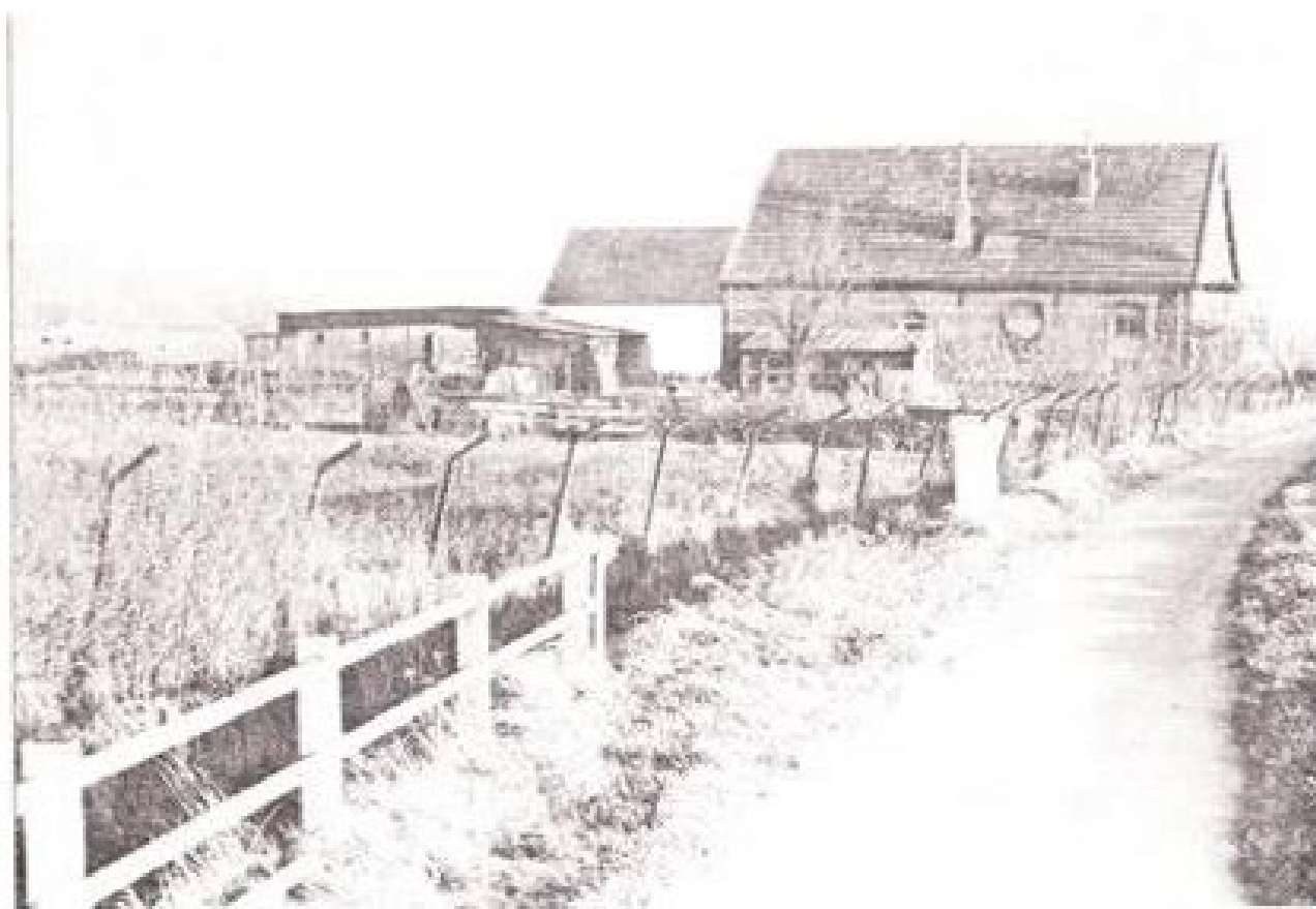
De gebouwen op het terrein met de naam 'De Noordakker' aan de Rijksweg. Op de voorgrond links, de leuning van de brug over de Leigraaf, die de grens was tussen Nederland en Pruisen.

De tweede groep, die van het bestaan van de grens profiteerde, bestond uit de Gelderse katholieken. In de Kleefse Liemers genoot men volledige godsdienstvrijheid. Dit had tot gevolg, dat reeds vanaf de zestiende eeuw zeer veel katholieken uit de Gelderse dorpen in de omgeving van Duiven en andere Liemerse plaatsen kwamen kerken. Een herinnering aan die godsdienstige omstandigheden, zoals die tijdens de Kleefs-Pruisische tijd hier heersten, vormen de processies die nog steeds in zwang zijn. Vóór de Tweede Wereldoorlog werd dat nog duidelijk gedemonstreerd door de Amsterdamse bedevaartgangers die, met de trein uit Kevelaar huiswaarts kerend, in Duiven uitstapten. Zij hielden hier nog