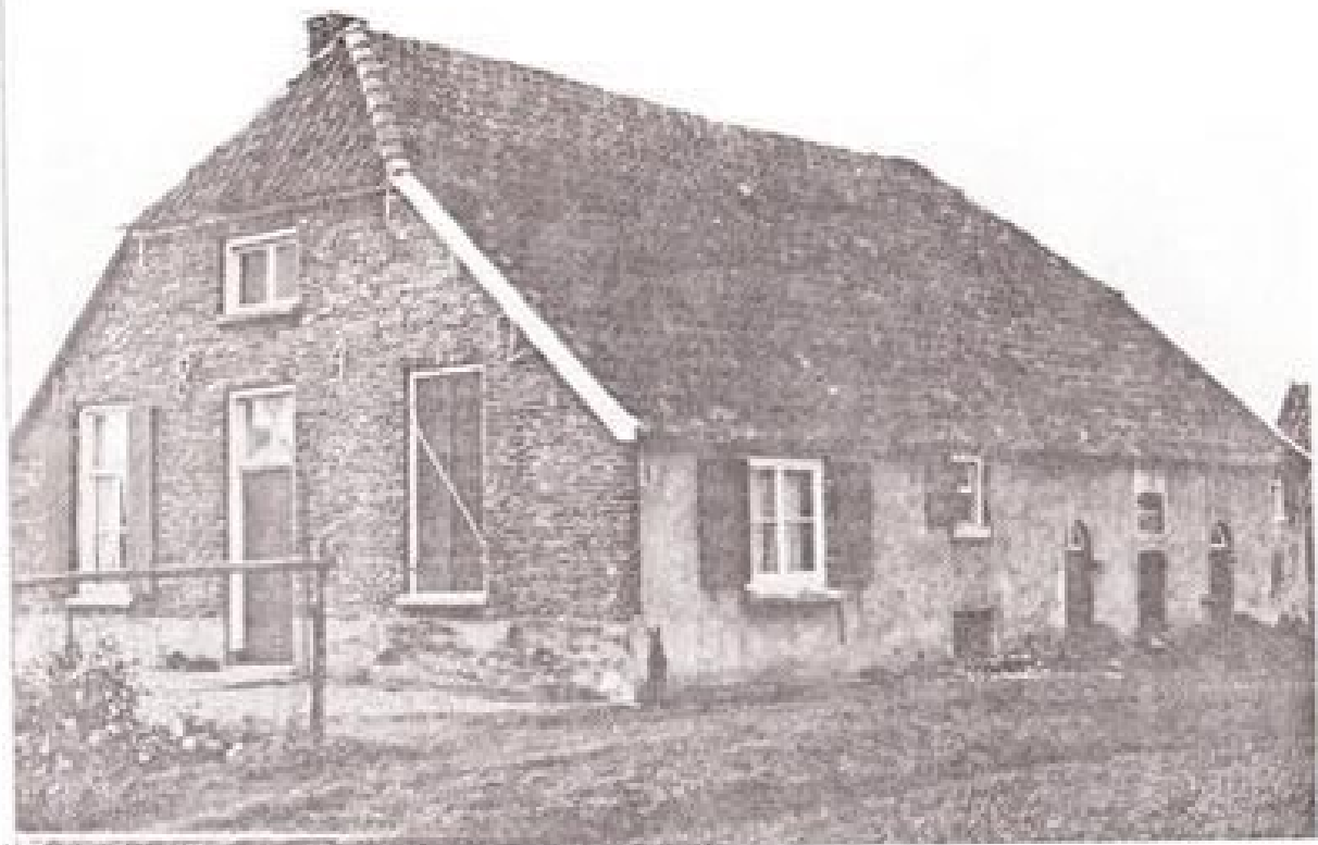
Leuvensedijk 1, Groessen. Dit fraaie boerderijtje is in 1982 door brand verwoest.

Verder willen wij nog de aandacht vestigen op de jubileum tentoonstelling