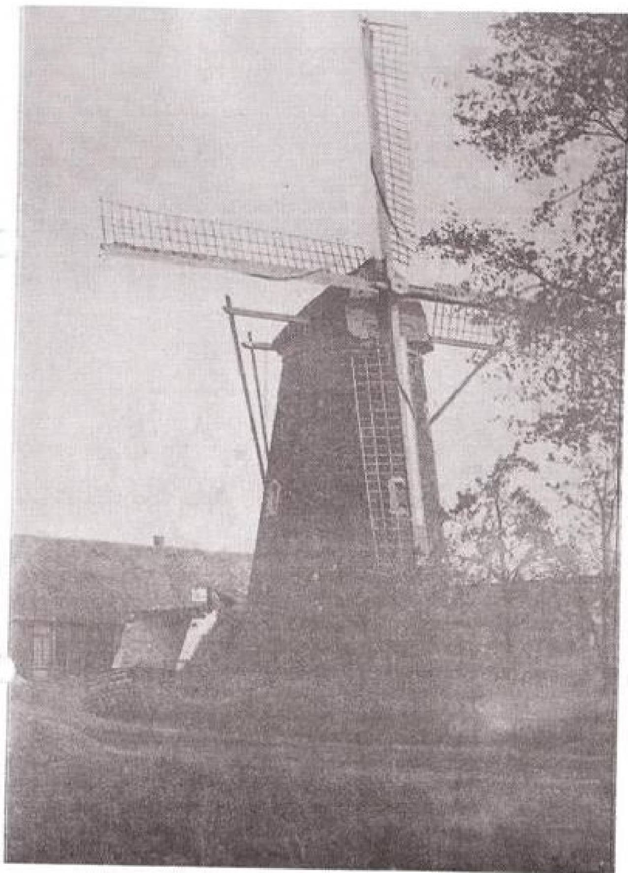
De molen aan de Eltensestraat, omstreeks 1932.