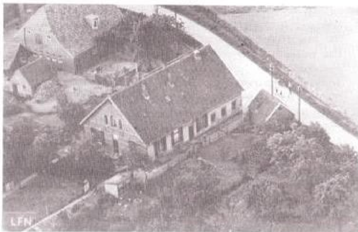
Luchtopname van ± 1950 pand van Henris Jansen vroeger Drikkus v. d. Laagt en links, pand van Frits Driessen.

De inloopavond van 9 september over De Droo heeft bijzonder veel belangstelling getrokken. Onder de 70 aanwezigen waren vooral veel oud-bewoners van deze vroegere buurtschap. En behalve verhalen over vroeger kwamen ook tal van foto's op tafel. Dat fotomateriaal vormde de basis voor de Droo-tentoonstelling, die op 14 september te zien was ter gelegenheid van Open Monumentendag. Ook hiervoor bleek grote interesse: ruim 100 bezoekers kwamen een kijkje nemen. Van verschillende kanten kwam ook de suggestie een speciaal boekje samen te stellen over deze vroegere buurtschap, die begin jaren zeventig moest verdwijnen om plaats te maken voor de nieuwbouwwijken van Duiven. Van de 35 panden, die er stonden, is er slechts één overgebleven. Bij het zien van de foto's van de vaak karakteristieke boerderijen - vele nog in goede staat - dringt de vraag zich op of dit werkelijk zo rigoreus gesloopt had moeten worden. Maar de bewoners hadden destijds geen andere keus dan vertrekken, met alle emoties en verdriet die dit heeft gegeven.