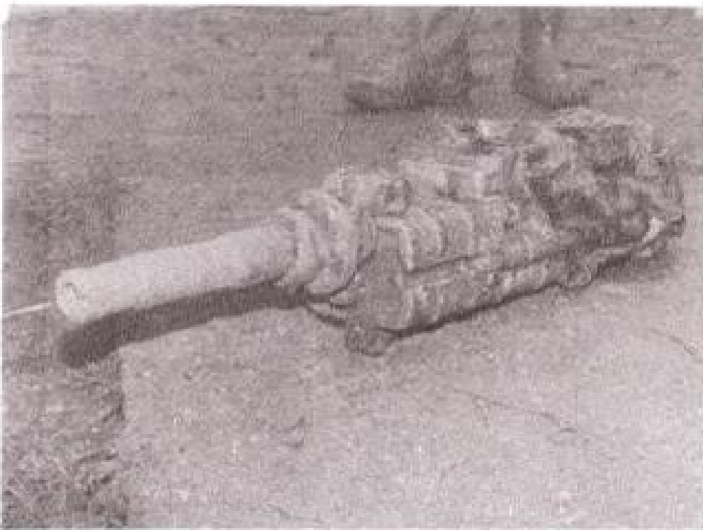
Boven: Berging van de Messerschmidt 109 te Doornenburg Onder: Boordkanon MK 108.3 cm