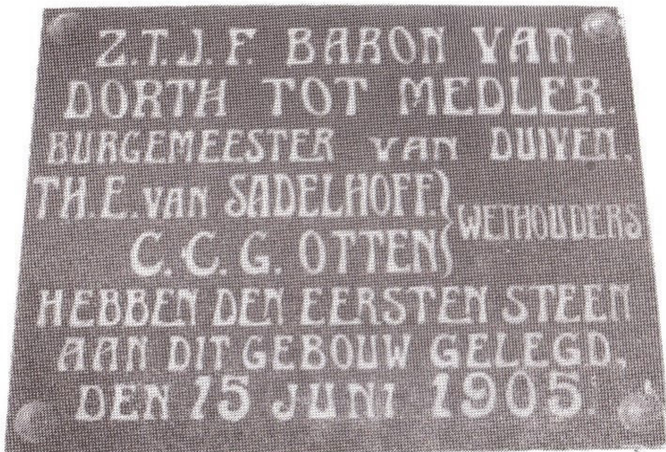
afb.3. De glazen plaat ter herinnering aan de eerste steenlegging bevindt zich nog steeds in de gang van het huis.