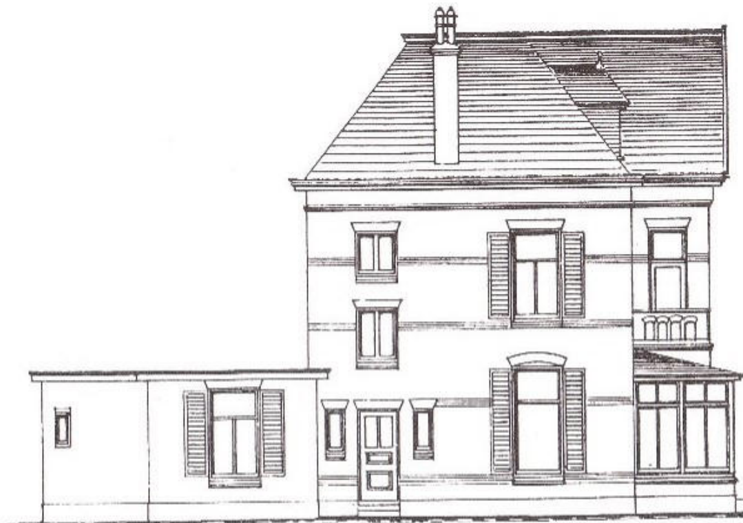
afb.2. Ontwerp dokterswoning te Duiven uit 1905 van architect H.J.L. Ovink uit Doetinchem. (uit het Ovinkarchief no. 414 ondergebracht in het Staring-instituut te Doetinchem).