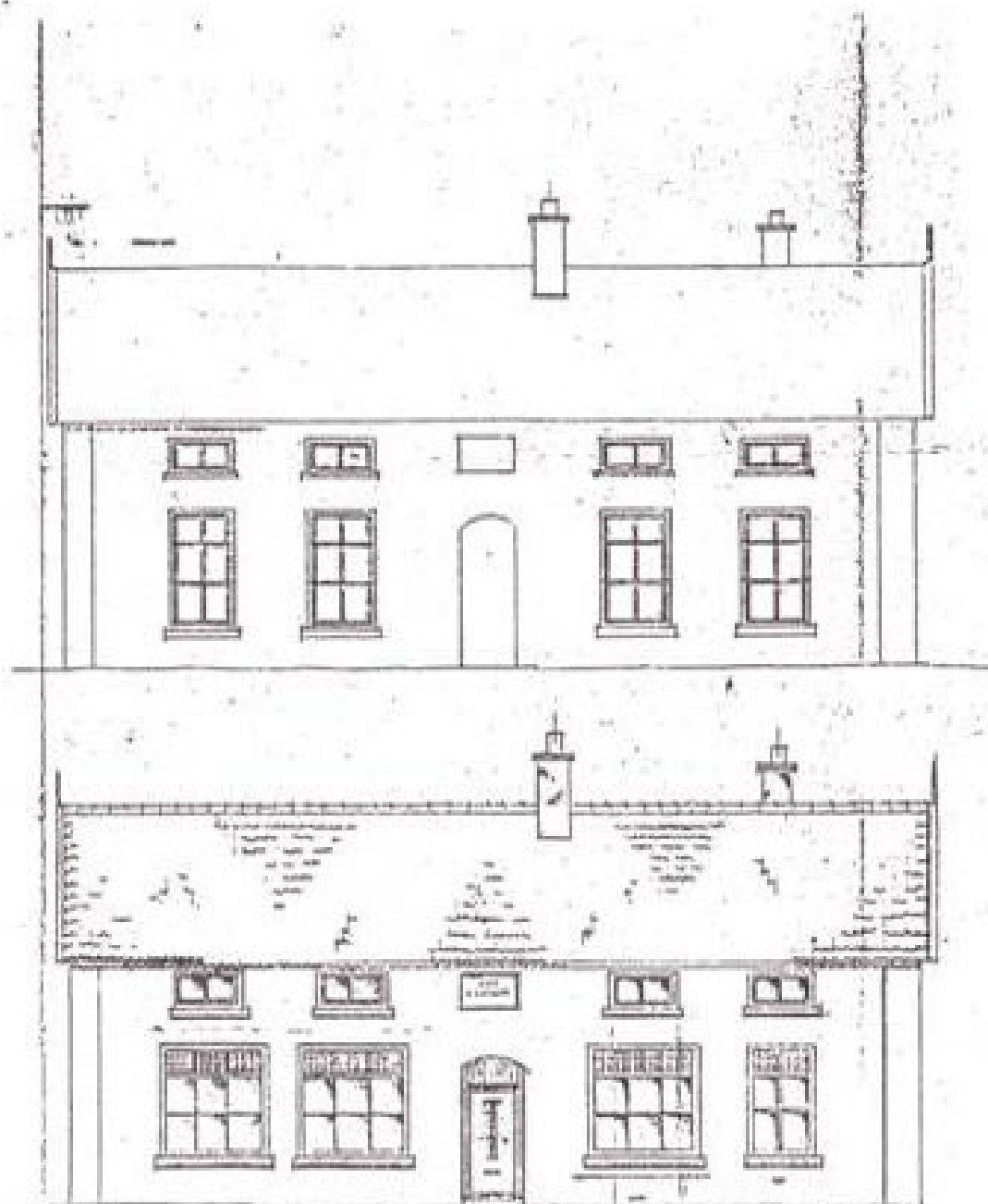
Afb. 3 Café Het Fortuin . De bovenste tekening geeft de vooroorlogse situatie weer, de onderste die uit het jaar 1949 (met dank aan G.Th. Berentsen).

In dit pand aan de Husselarijstraat waren ook een kruidenierswinkel, een kolenhandel en het café „Het Fortuin" gehuisvest (afb.3).