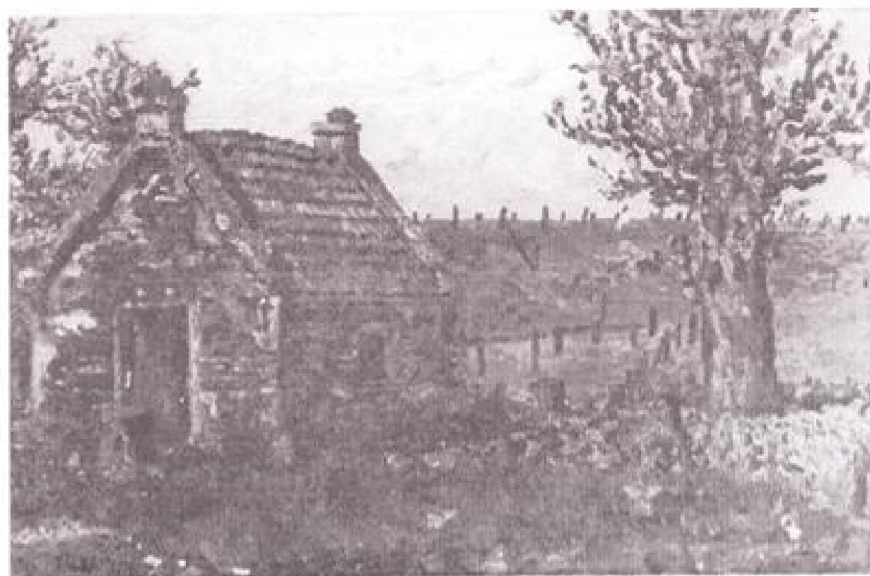
Afb. 1 Het bakhuis bij Doekenstadt aan de Loostraat 60 te Loo (olieverfschilderij van W.J. Th. Peters).

In 't Loo heeft nog heel lang een bakhuis gestaan bij boerderij „Doekenstadt” aan het eind van de Loostraat tegen de dijk aan. Het bakhuis hoorde niet bij het huidige pand „Doekenstadt” maar bij de oude boerderij, die iets meer naar de dijk, in de huidige moestuin heeft gestaan. Het bakhuis stond in verband met brandgevaar een eindje verwijderd van de eigenlijke boerderij. In de vorige eeuw werd hier het brood gebakken voor de bewoners van de boerderij en misschien ook wel voor burens, zoals in die tijd vaak gebeurde. Soms werd er voor een heel buurtschap gebakken want deze bakhuizen waren de voorlopers van de bakkerijen.