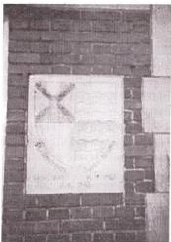
Het wapen van Groessen op een gevelsteen.

De woensdagavond blijft tot in de zestiger jaren de soosavond bij uitstek.