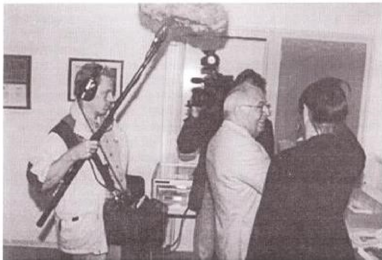
Zelfs het NOS-journaal toonde belangstelling bij de Open Monumentendag in Duiven.

Als u die belangstelling deelt en f 7,50 overmaakt op een van de rekeningsnummers van de Historische Kring (zie voorin in dit tijdschrift) overmaakt, wordt het u - althans binnen de gemeente - thuis bezorgd.