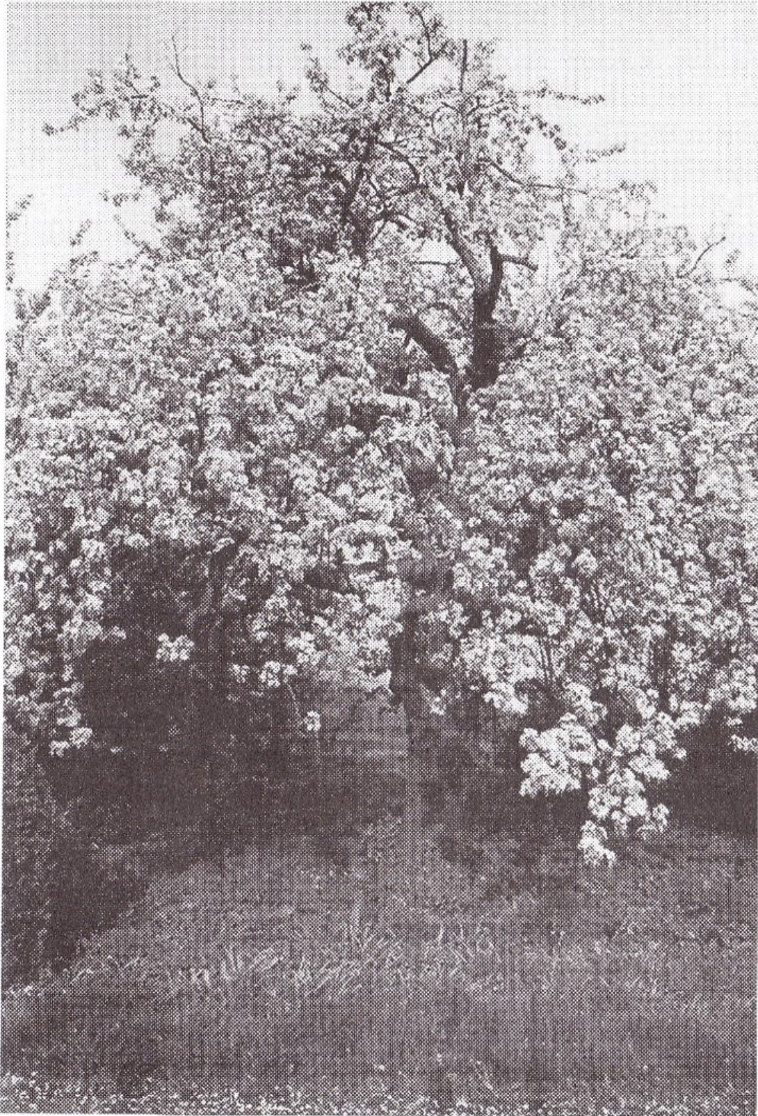
De kraaipeerboom in volle bloei in het voorjaar van 1998.