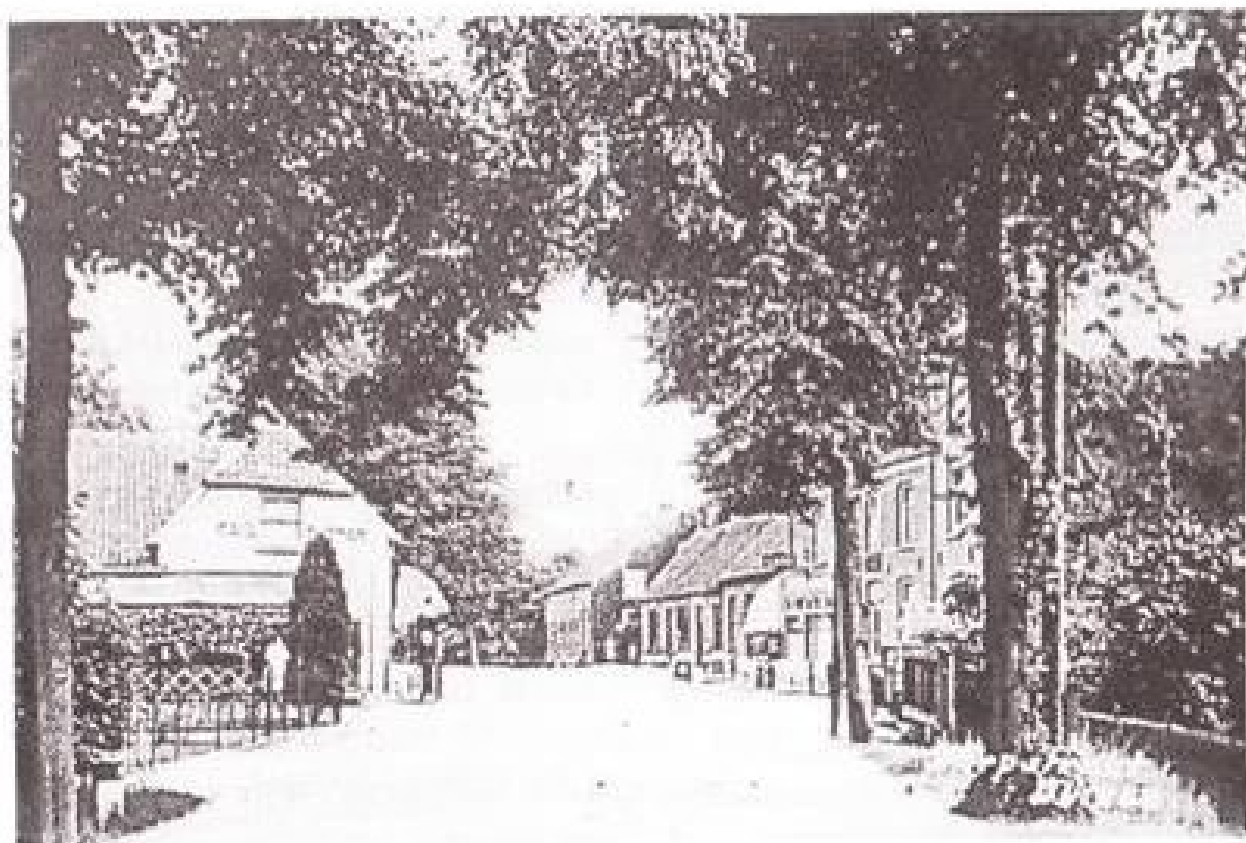
Zo rustig was het op de Rijksweg in 1934. Links café Polman met Texaco-benzinepomp, rechts café Hugén met Exso-pomp. Eén liter benzine kostte in die dagen f 0,12 per liter.