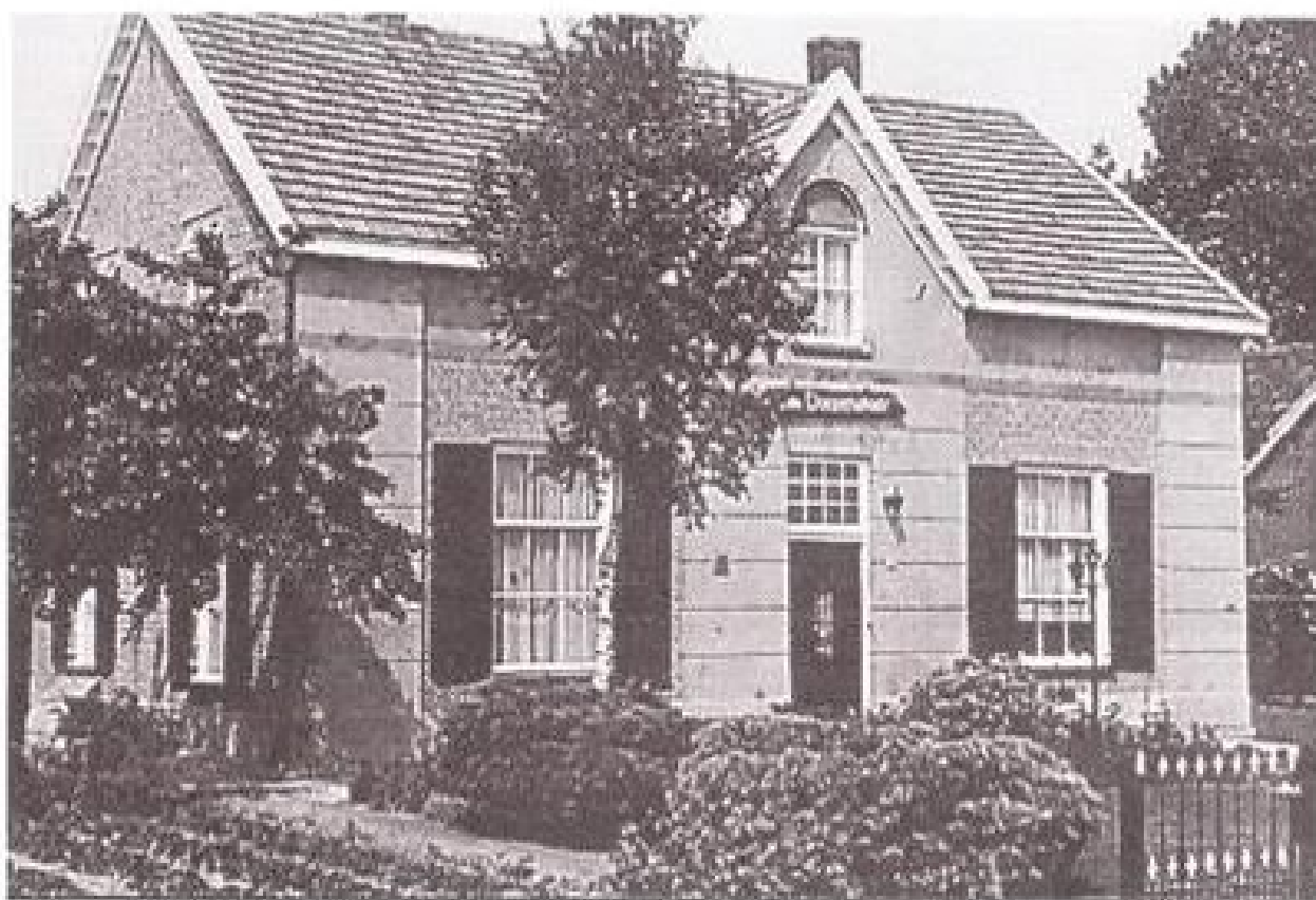
Doekenstadt in de jaren tachtig.

In 't Loo staat rechts bijna aan het einde van de Loostraat, vlak bij de oprit naar de dijk, een vrij imposante boerderij met de intrigerende naam DOEKENSTADT; althans het intrigeerde mij. Iedereen die er langs rijdt of wandelt moet die boerderij met die naam zijn opgevallen. Wat is de oorsprong van de naam?