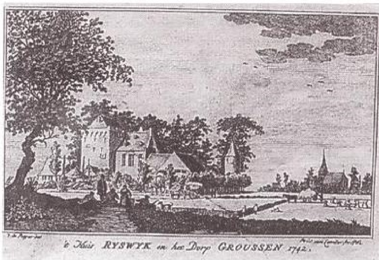
Het kasteel Rijswijk te Groessen in 1742 - Tekening door Jan de Beijer (met dank aan Het Liemers Museum, Zevenaar).

De Nederrijnse variant daarentegen, te beginnen met Rijswijk bij Groessen, Riswick bij Kleef, Riswik bij Dusseldorp, zijn geen dorpen maar havezaten of kleine landgoederen. Vermoedelijk is de oorsprong dus een hoeve en geen handelsplaats. Uitzonderlijk is dat niet, want wie de topografische kaart van de Liemers en het aangrenzende Kleefland bestudeert, vindt verschillende -wik of -wijk namen. Bij Drempt lag eens de hoeve Lakewik, bij Oud-Zevenaar ligt Poelwijk, in de buurt van Rees zijn meerdere hoeven met -wijk of -wik namen: Schütwik, Veldwik, Merwik, Hagewik, Wanwik.