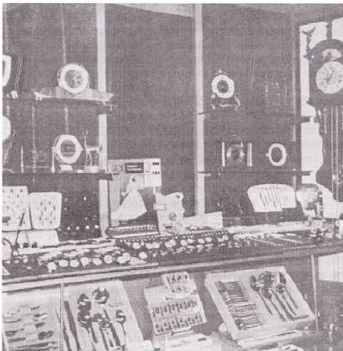
De gemoderniseerde etalage in latere jaren.