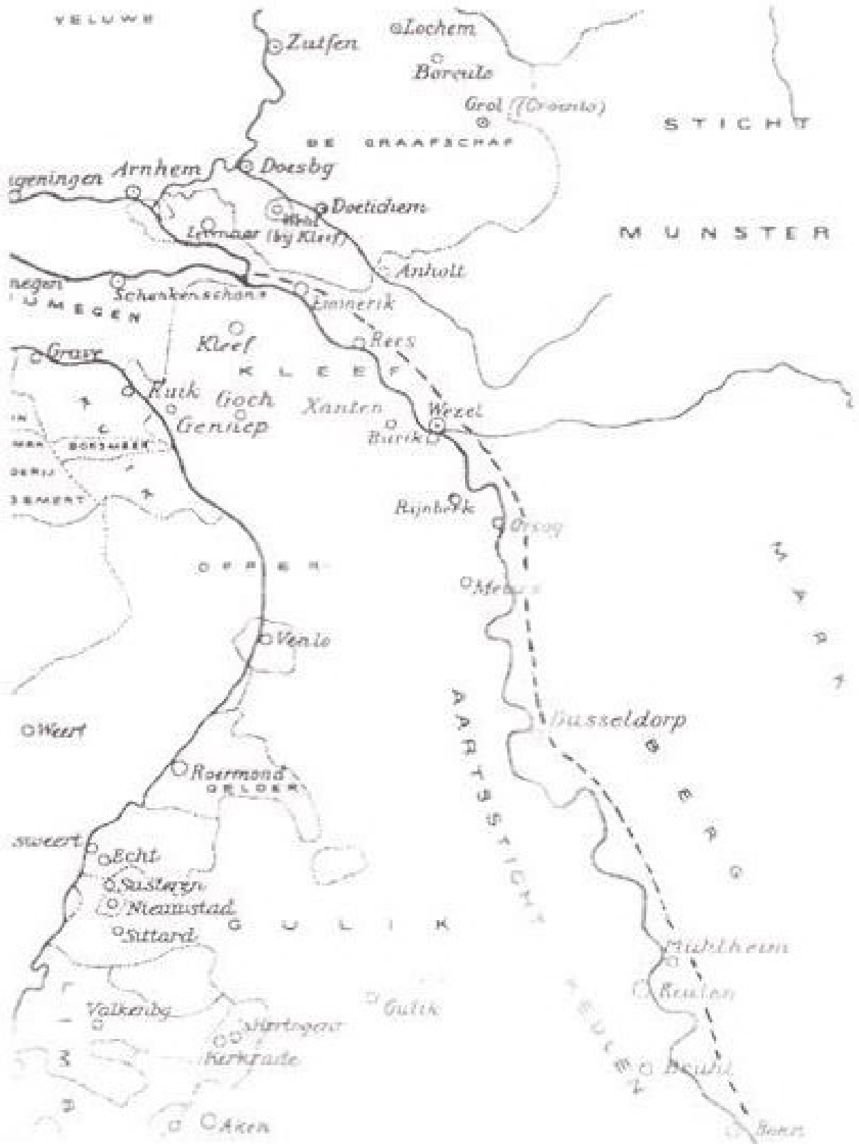
De staatkundige situatie omstreeks 1672. Vanuit Bonn trekken de Franse legers (--) langs de rechter Rijnsoever door de Kleefse gebieden op naar het hart van de Republiek.