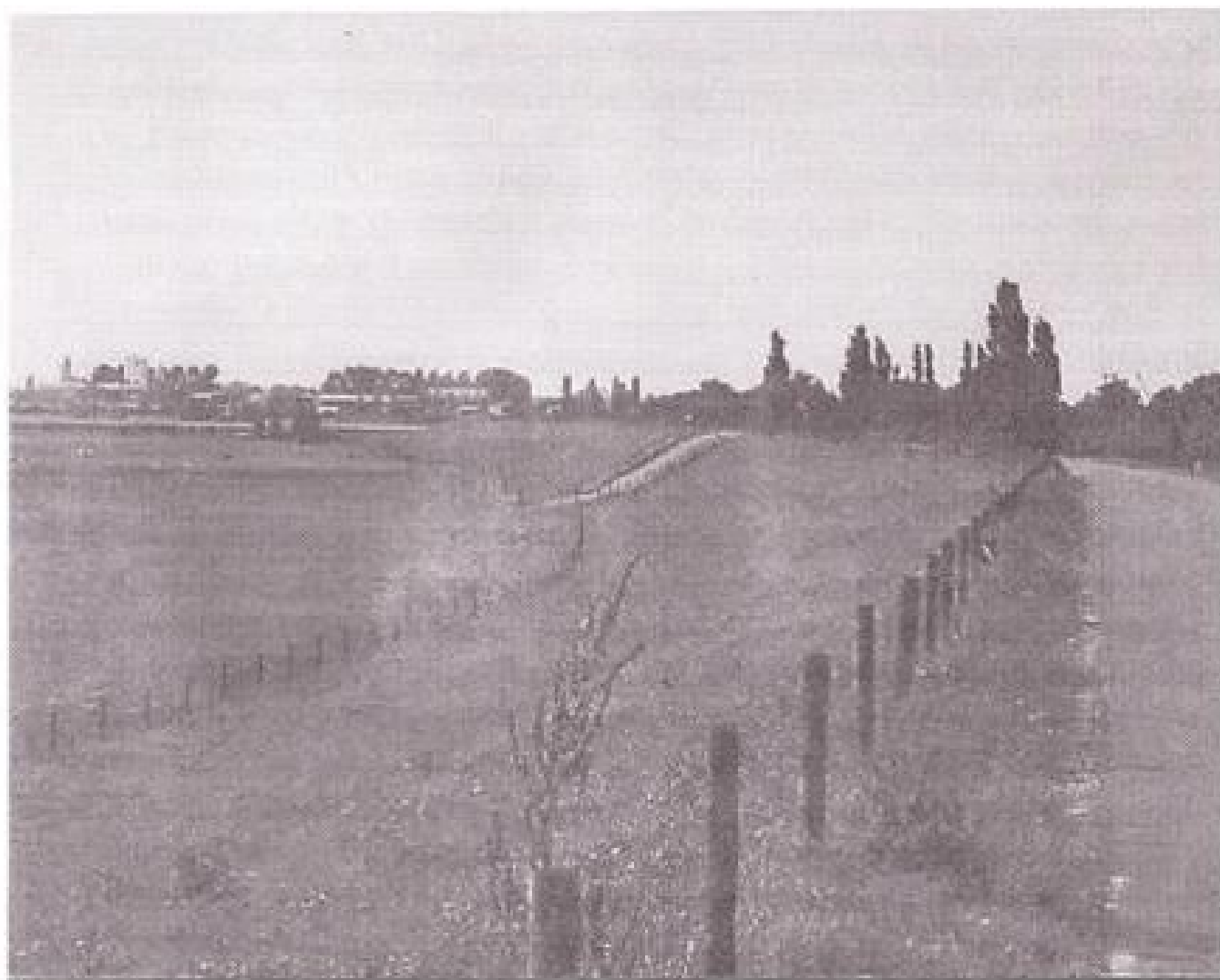
De Dorrenheuvel anno 1999.

Het zou een geheel aparte zoektocht vergen om er achter te komen hoe en wanneer de familie Hoppenreij's de pandbezitter is geworden in plaats van de familie Van WestRhenen. Voor het verloop van het relaas is het echter alleen maar belangrijk te weten dat er nu met deze familie na de zgn. opkonding moet worden onderhandeld.