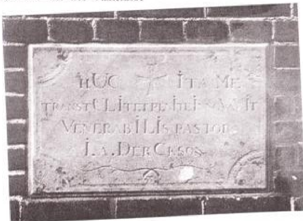
Afb. 1. De gevelsteen.

(zie bij C, afb. 3), is bij de restauratie van dit gebouw omstreeks 1992 naar beneden gehaald en op ooghoogte aangebracht, links van de grote deur. De maten, in genoemd artikel naar schatting aangegeven, konden nu precies worden vastgesteld: 38,5 cm x 60,8 cm. Ook kon er gemakkelijk een foto gemaakt worden (afb. 1).