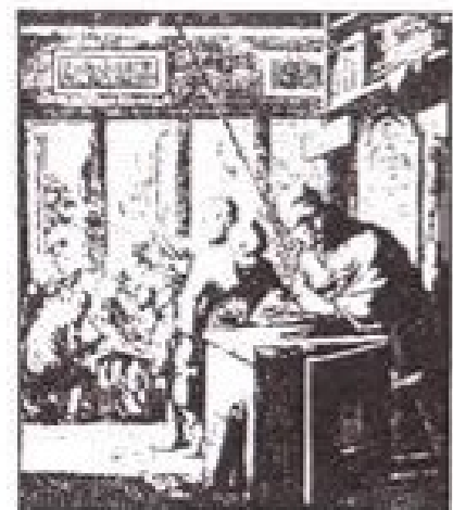
De Schoolmeester, Johannes & Caspar Luiken, 1694.

De schooltijden waren gedurende de winter van acht tot elf uur en van één tot vier uur en des zomers naar believen, doch tenminste drie uur.