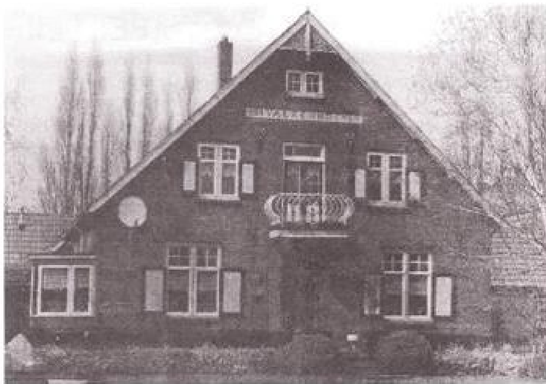
Afb. 4. Valkenhof anno 2001.

Dan nog iets over de naam VALKENHOF . Eerder (1) is melding gemaakt dat de naam van de Loose boerderij DOEKENSTADT een respectabele ouderdom heeft.