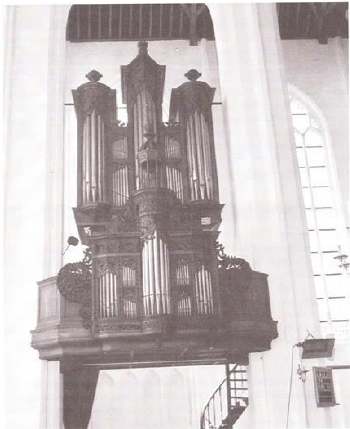
Het orgel in de St. Baafkerk te Aardenburg (foto W. Klappers).

Met het ontbreken van het jaartal en het noemen van de naam Keurten beginnen ook de raadsels rond dit in 1953 uit Groessen afgevoerde orgel.