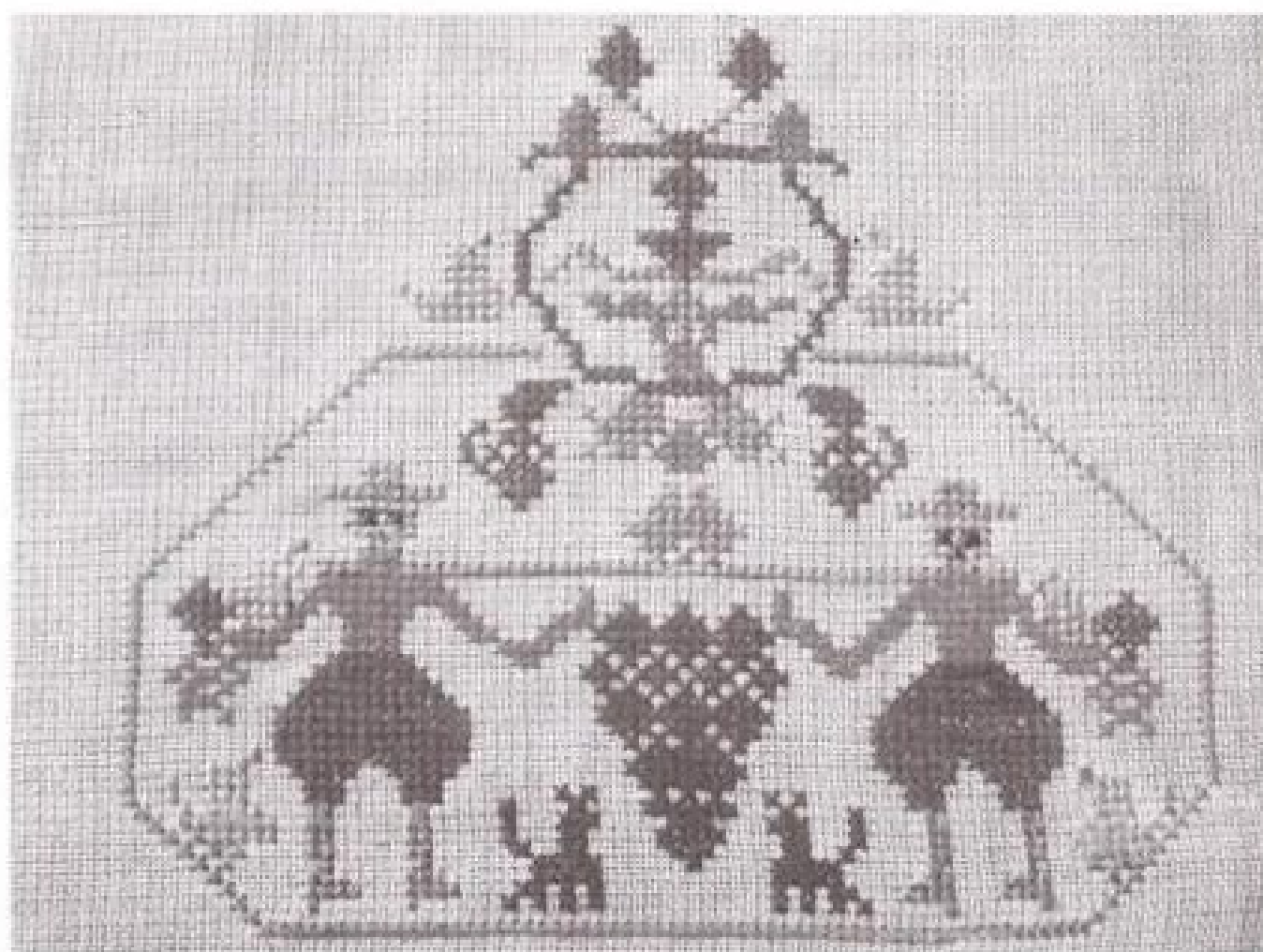
Afb. 3 De druivendragers