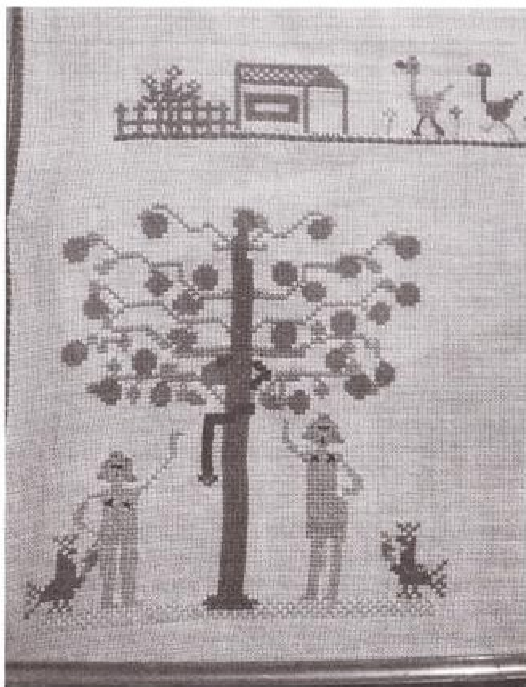
Afb. 2 De Boom van Goed en Kwaad

Het meisje zal acht à negen jaar oud geweest zijn toen ze deze lap maakte. Opvallend zijn een ABC in kapitalen en na de laatste letter 5 kleine zgn. strooimotiefjes. De initialen F V van het meisje staan groot links en recht op de lap en daartussen het jaartal 1868. Dan staat er DUIVEN met een duif in blauw met een beetje geel en schuin eronder GELDERLAND, geborduurd met rode katoen. Verder volgen de merklapmotieven waarvan de eerste een lange lijn is met een huisje met een omheinde tuin, en zeven ganzen met de ganzen hoedster, waarschijnlijk het meisje zelf. Linksonder staat de BOOM VAN GOED EN KWAAD met Adam en Eva; de slang zit in de boom om de stam geslingerd. Aan weerszijden van de blote Adam en Eva staan mooie kippen als versiering (afb. 2).