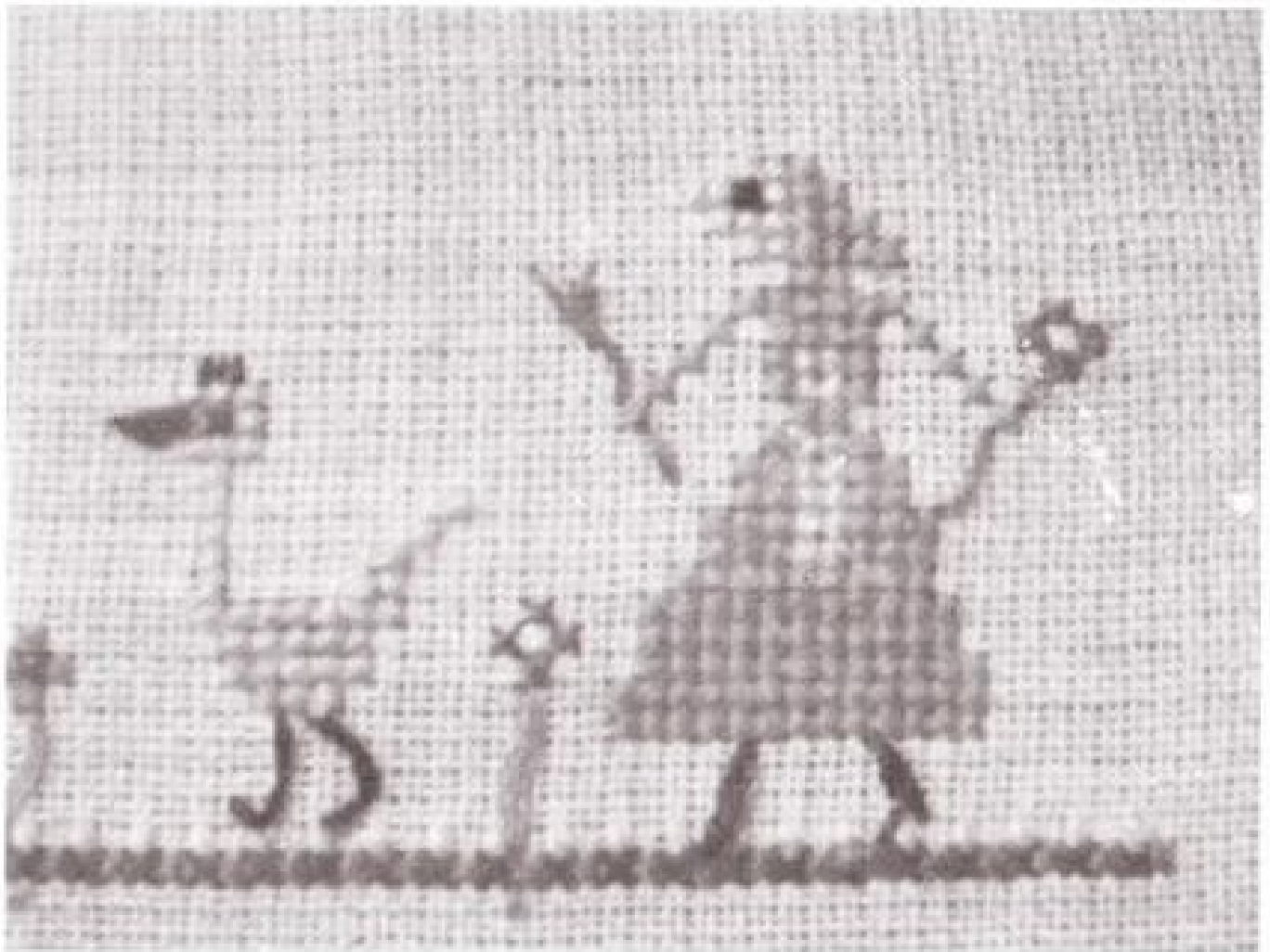
Afb. 4 Het ganzenhoedstertje