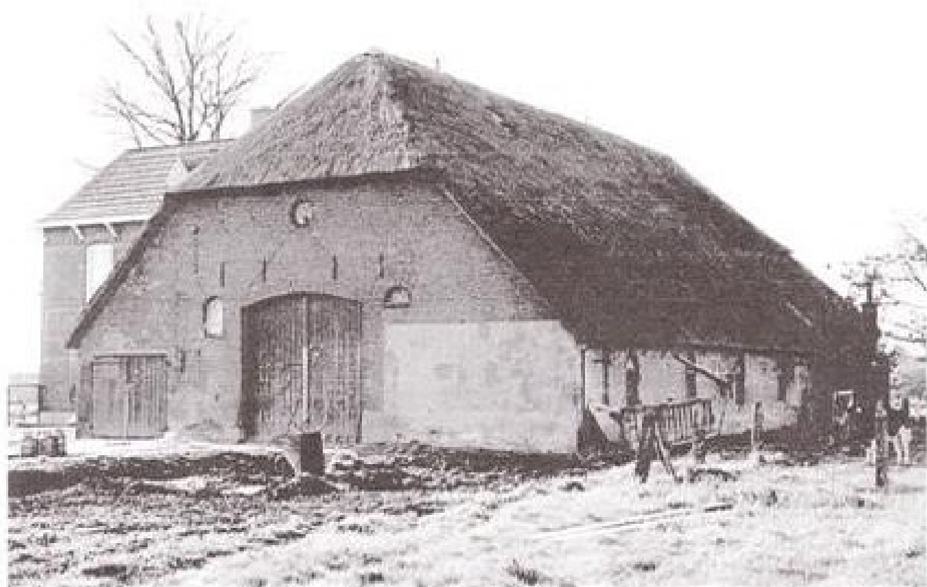
Schuur bij boerderij Vosboere