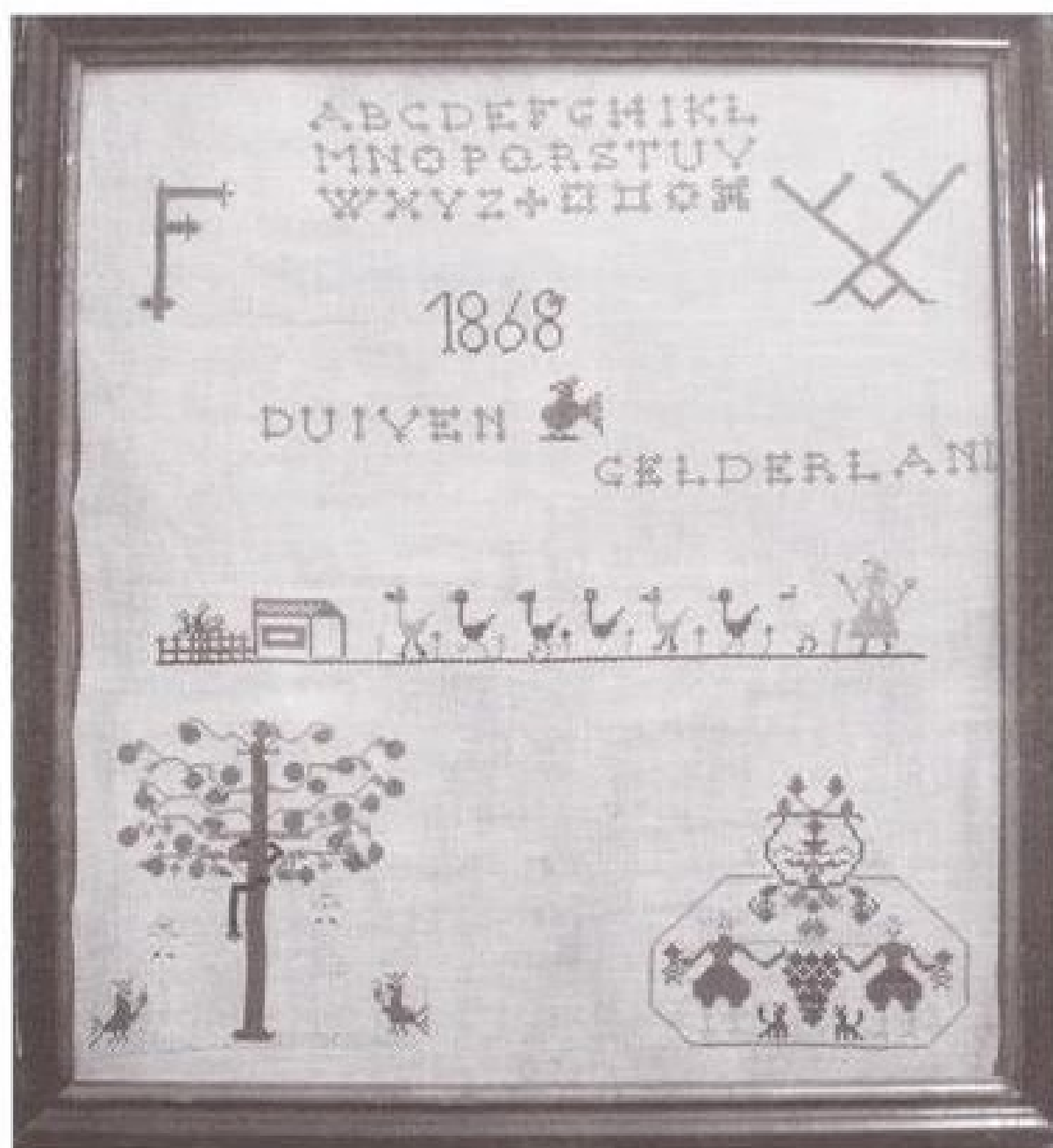
6/Afb. 1 De merklap uit Duiven

Een bijzondere vondst op de veiling van het Notarishuis te Arnhem in 2004 leidde tot de aankoop van een merklap uit 1868 gemaakt door een Duivens meisje met de initialen F.V. De lap is gemaakt van gekleurde katoenen garen op stramien en is ingelijst in een oude houten lijst (buitenmaat 55x60cm). Het is de originele lijst met het oude glas er gelukkig nog in. Wel dient de lap geconserveerd te worden om verder verval te voorkomen (afb.1).