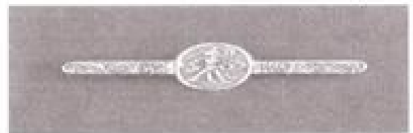
De heren ontvingen een dasspeld