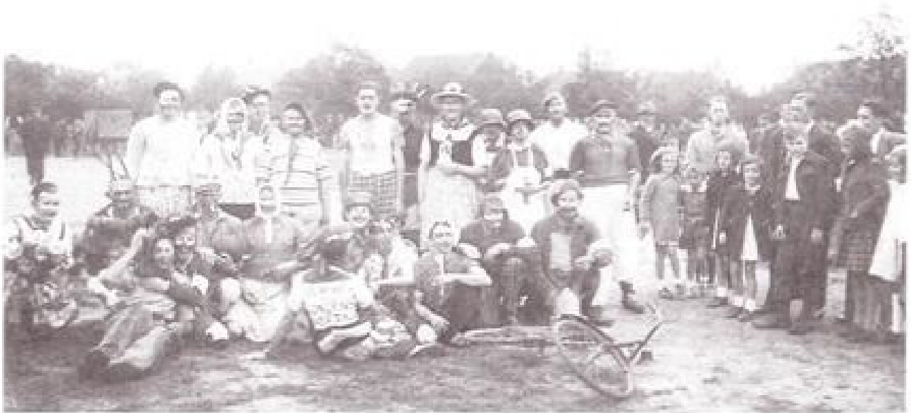
Toeschouwers en gekostumeerde voetballers op het voetbalveld op De Droom,