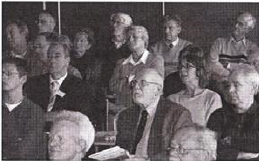
Symposium 300 jaar Pannerdensch Kanaal: de sprekers konden rekenen op een aandachtig geboor.