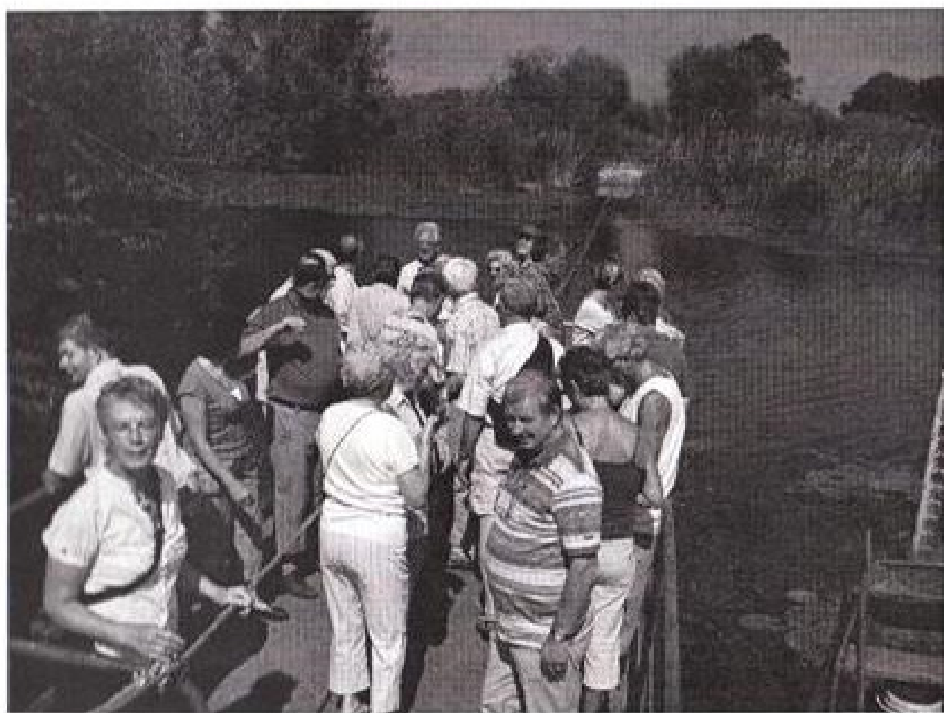
Van de Oude Rijn rijden de excursie op 25-08-2007.